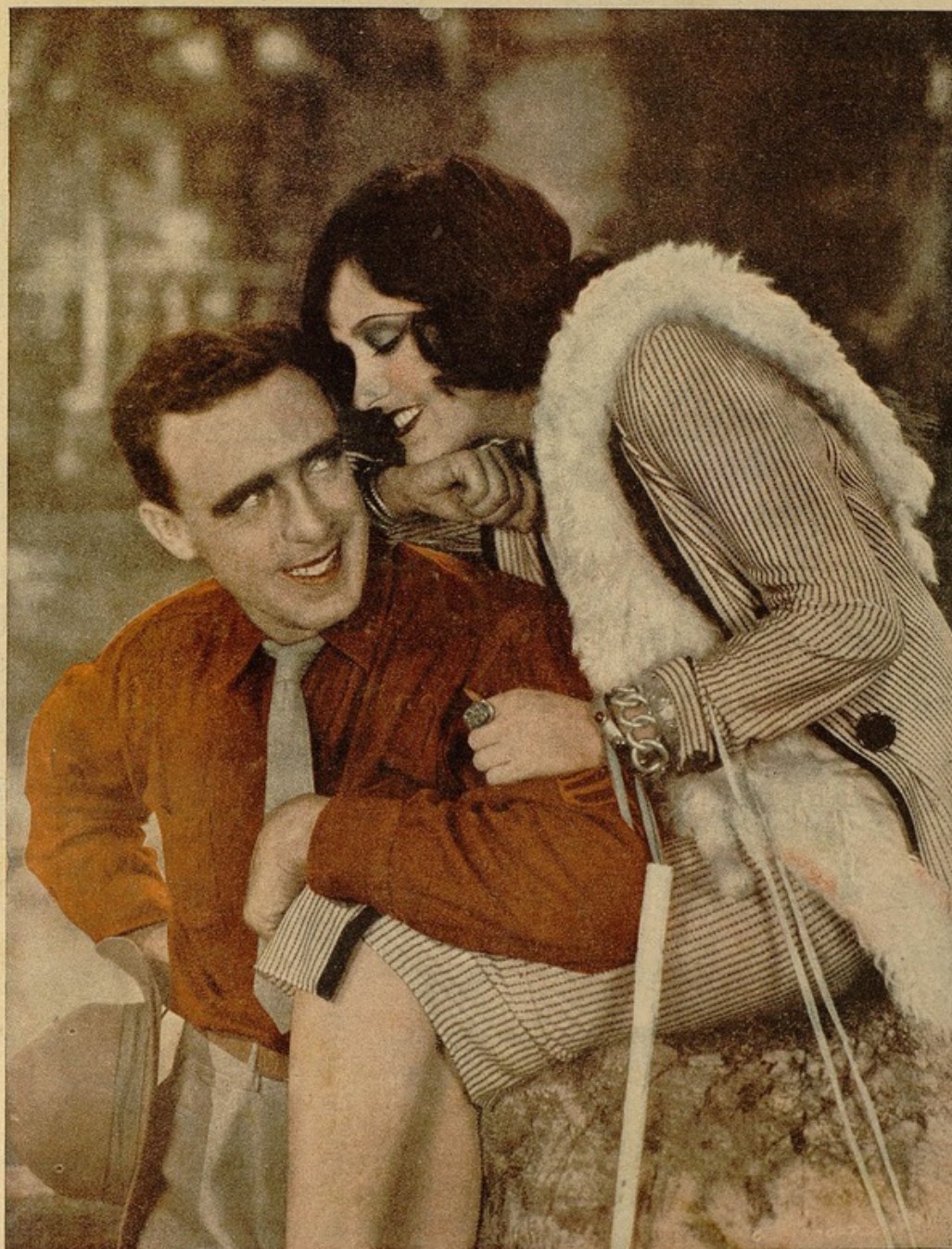
Gloria Swanson y Raul Walsh, en una escena de «Sadie Thompson», de los ARTISTAS ASOCIADOS