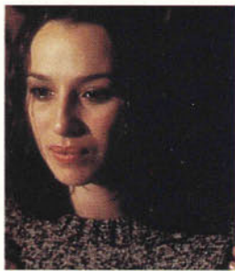
Ariadna Gil ISABEL

Tras llamar la atención de Bigas Luna, éste le ofrece debutar en el cine con un pequeño papel en "Lola". A continuación, ya decidida a abrirse camino como actriz, se matricula en Arte Dramático en el instituto de Teatro de Barcelona, alternando dichos estudios con nuevos trabajos dramáticos, tanto en cine y la pequeña pantalla (TV3) como sobre los escenarios, en el Teatro Lliure y con la Compañía Puigcorbé-Dueso-Planella. De esta época destacan las películas "El complot dels anells", "Capitán Escalaborn", "Barcelona Lamento".