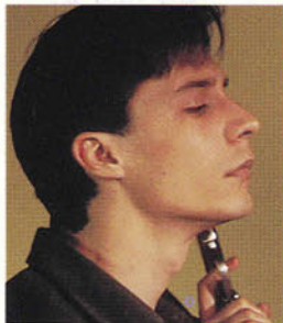
Fele Martínez ANDRÉS

Por su siguiente película, "Belle Epoque", (Oscar a la Mejor Película Extranjera) recibió el Premio Goya 1992 a la Mejor Actriz y más tarde participó en las siguientes películas de gran éxito: "Todo es mentira", "Los peores años de nuestra vida", "Antártida", "Tranvía a la Malvarrosa", "Malena es un nombre tango" y "Libertarias".