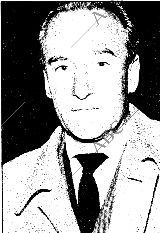
George Sanders confesaba en su nota: «Me suicido porque estoy aburrido y porque ya he vivido suficiente»