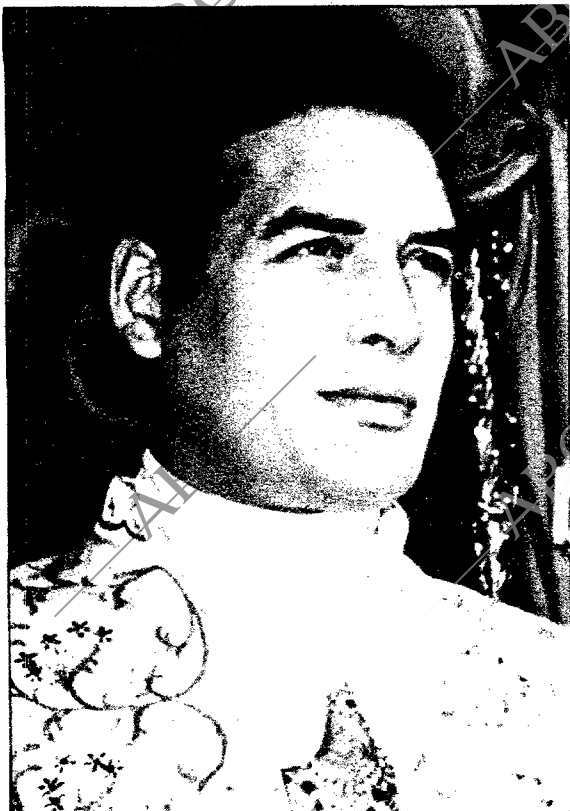
Jorge Mistral pedía perdón en una nota a sus amigos por hacerles vivir algo «tan feo y desagradable»