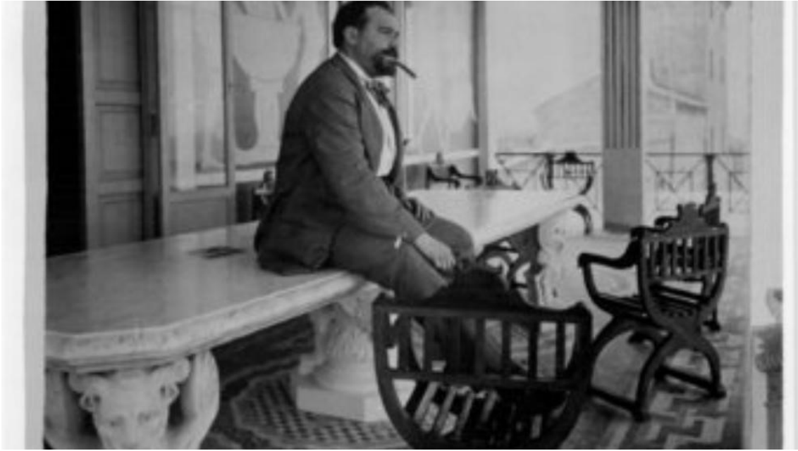
Blasco Ibáñez, en su casa de La Malvarrosa