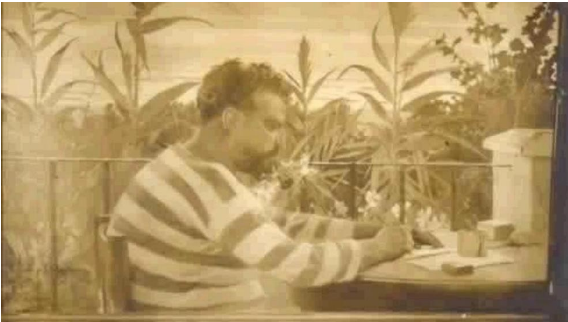
Retrato de Vicent Blasco Ibañez (Propias)