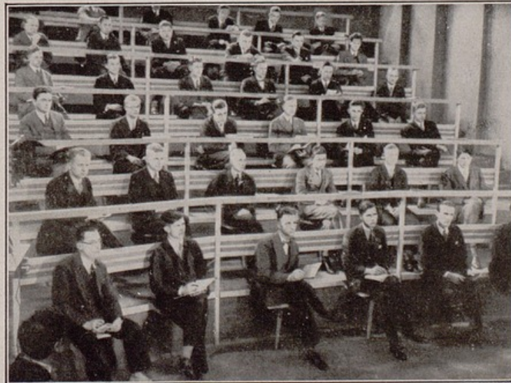
«El enemigo en la sangre», de Walter Ruttmann.

En la prensa cinematográfica española se ha iniciado una campaña contra la sincronización de películas extranjeras en castellano. Ha logrado proporciones tan alarmantes, que algunas veces, después de implorar al Gobierno de la República una intervención en el asunto, se ha pedido también una protec-