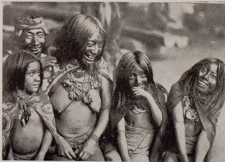
«Au pays de Scalp», documental del Amazonas, del marqués de Wavrin.

A la parte industrial, incumben las responsabilidades financieras, la cualidad — yo subrayo comercial — del film que debe responder, para su mayor difusión, al gusto del público de su país de origen y al del mundo entero.