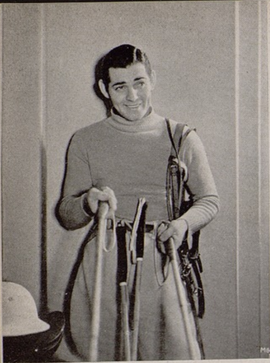
Clark Gable, a quien los departamentos publicitarios señalan como el «auténtico» sucesor de Valentino...