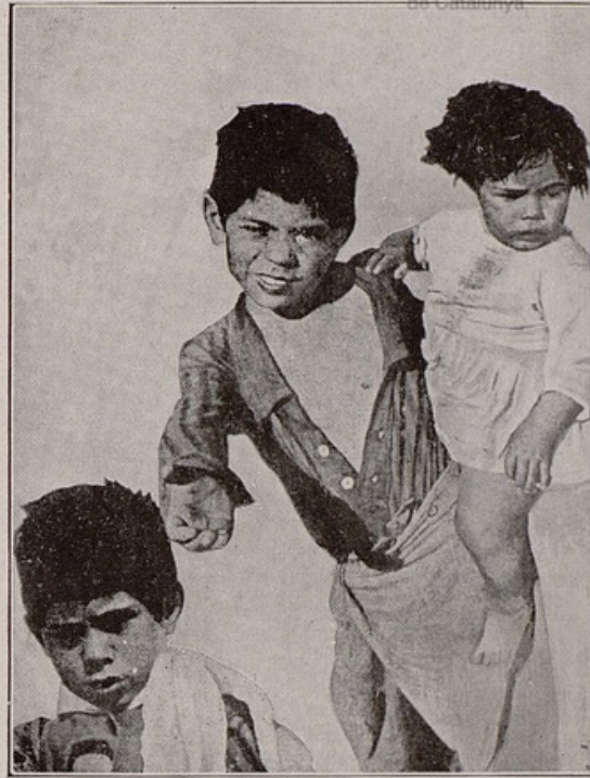
«El camino de la vida», de Nicolay Ekk

tanto, eliminadas por la vida misma. Muy pronto esta verdad va a demostrarnos que nuestro arte cinematográfico quedará abierto a todos los temas del cielo y de la tierra; a todos los temas del pasado, del presente y del porvenir, y que la particularidad de nuestro arte proletario subsiste menos en la elección específica de la materia que en la proyección particular de luz, solamente posible a las diversidades infinitas de la vida. Naturalmente, nuestra cinematografía tiene ya algunos rasgos que son originales en un alto grado y que — como espero — no perderá terreno, sino que, por el contrario, ha de ganarlo y desarrollarse.