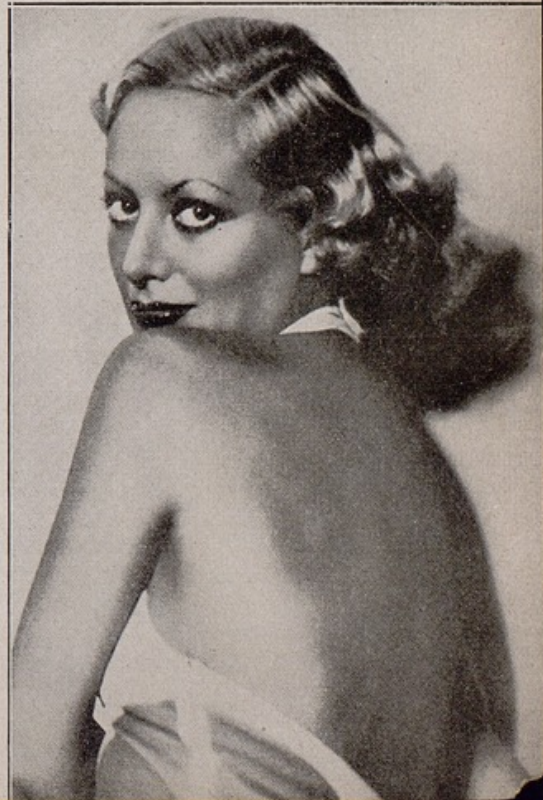
Joan Crawford o el triunfo del «sex-appeal» femenino en el cinema.