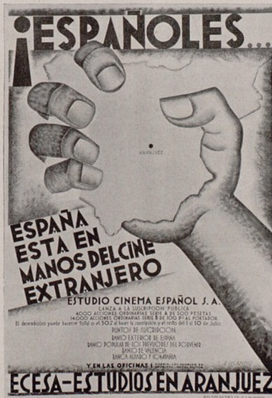
Cartel de la ECESA