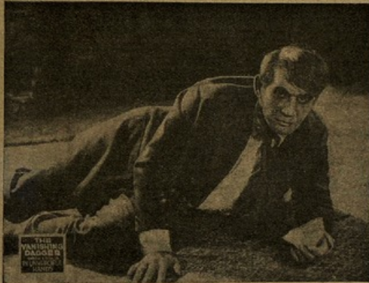
«La daga misteriosa»

Pero Sara no es mujer con quien se pueda jugar impunemente. Aprovechándose de un descuido del mahadí encierra a Ruth en un calabozo donde anidan tarántulas, cuya picadura es mortal.